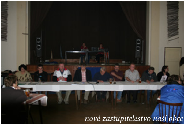
nové zastupitelstvo naší obce

Před měsícem jsme si zvolili zastupitele, druhého listopadu se konala ustavující schůze, kde bylo zvoleno vedení obce a nyní je čas na závěrečné shrnutí. Zastupitelé